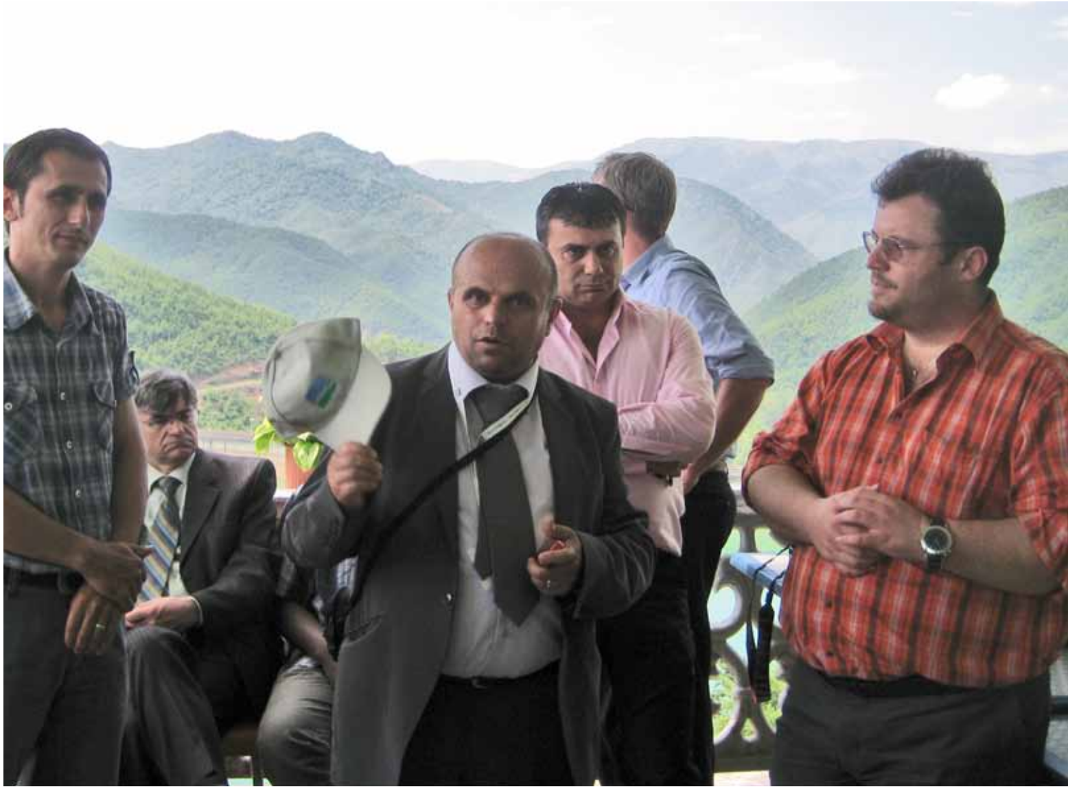
Participantes de Albania