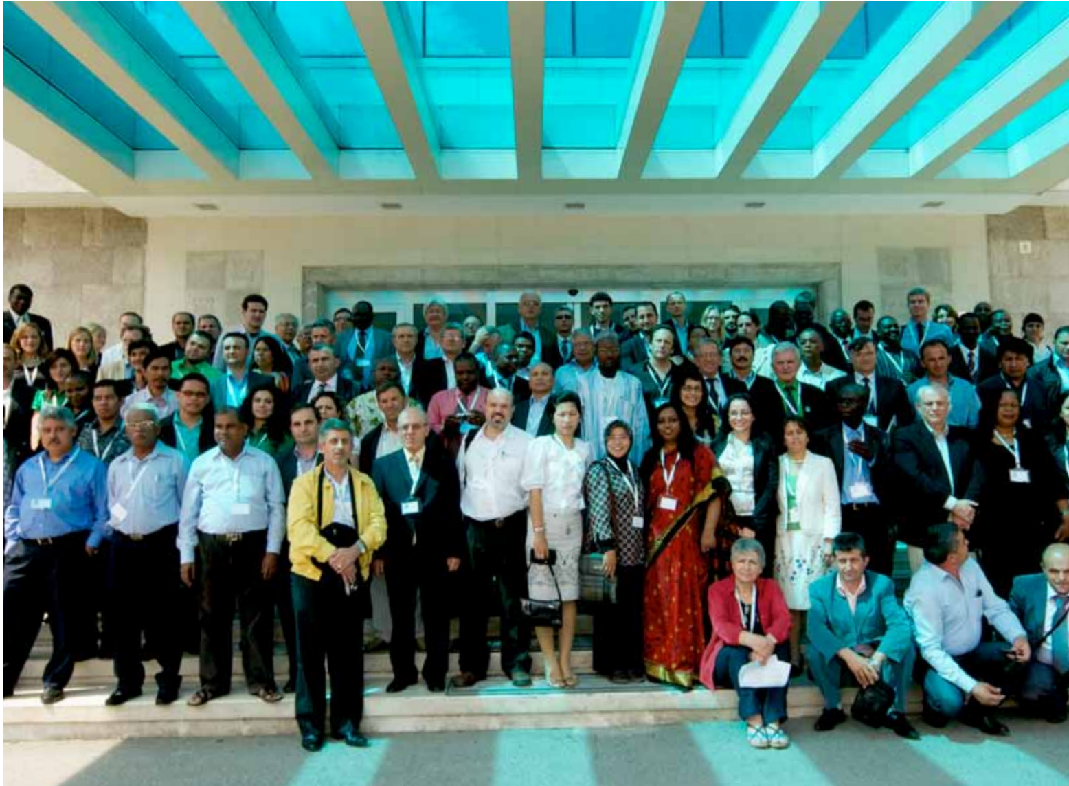
Miembros y socios de la ILC de más de 45 países se reúnen para la 5a Conferencia Internacional Bienal y Asamblea de Miembros, 24 - 27 de mayo 2011 en Tirana, Albania