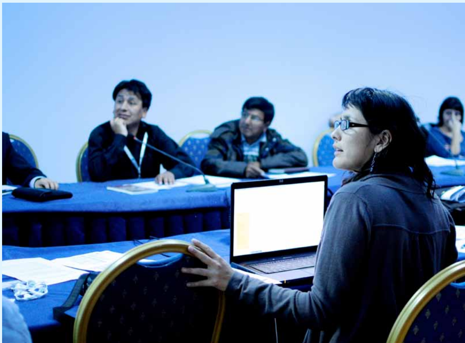
Asamblea regional de América Latina