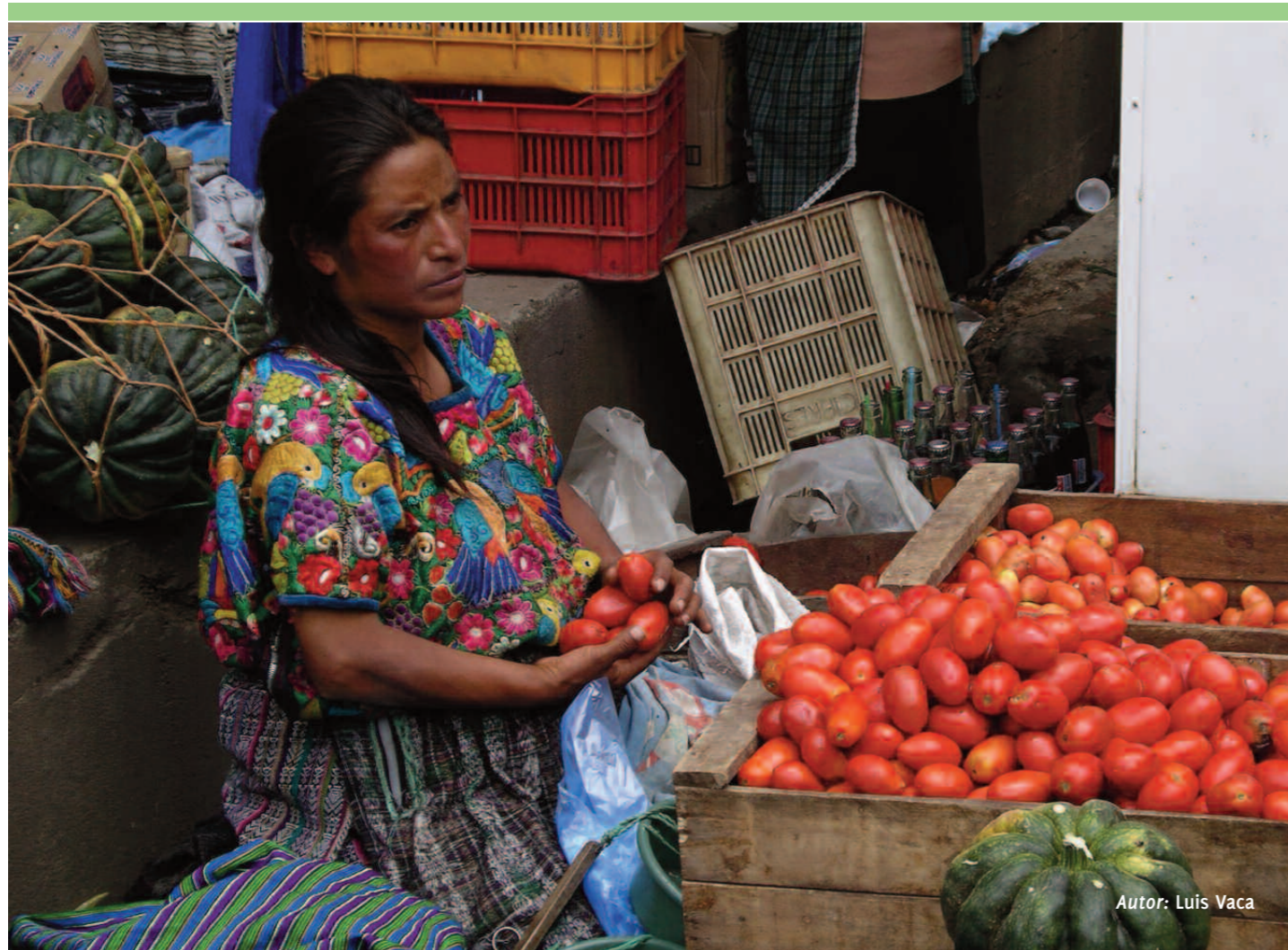
Autor: Luis Vaca

El empoderamiento de las mujeres rurales es clave para que puedan participar en la sociedad con igualdad. Este empoderamiento debe darse en los ámbitos políticos, jurídicos y económicos y pasa por asegurar a las mujeres un acceso seguro a la tierra y a los recursos naturales. Un mayor acceso a la tierra permitirá a las mujeres tener mayor visibilidad y participación en la esfera pública, así como en los procesos de toma de decisión.